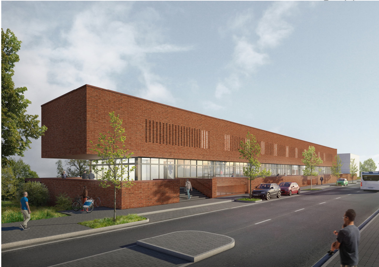
Abbildung 1: Visualisierung Neubau